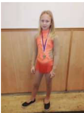
24.11.2018 TRUTNOVSKÁ BRUSLIČKA